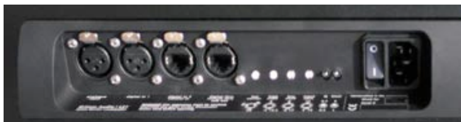
Das im Lautsprecherstativ angebrachte Anschlusspanel des LS1

borgt“ wurde. Die A/D- und D/A-Umsetzung erfolgt mit einer Wortbreite von 24 Bit bei 187 kHz Abtastrate, die wohl absichtlich auf diesen ungewöhnlichen Wert gesetzt wurde, um möglichst kein „gerades“ Verhältnis zu gebräuchlichen Abtastraten zu bilden. Der DSP ist ein 48-Bit-Typ mit einem 76 Bit Register. Das Ausgangssignal des D/A-Wand-