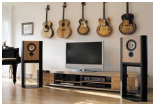
Spielt im Studio wie im Wohnzimmer: Der LS1

mit einem maximalen Schalldruck von 109 dB SPL (in einem Meter Abstand gemessen) relativ schnell an die Leistungsgrenze des LS1. Für mich und meine Hörgewohnheiten war das mehr als laut genug, aber ich kenne auch Kollegen, die damit nicht zufrieden wären. In diesem Fall hilft der Anschluss eines passenden, externen Subwoofers, der den LS1 im Bereich der Tiefen entlastet und damit auch höhere Abhörlautstärken ermöglicht. Nach dieser kleinen ‚Kraft-Diskussion‘ zurück zum viel wichtigeren Klangeindruck: Man kann mit dem LS1 extrem weit in die Tiefe einer Aufnahme hineinhören und erlebt eine nicht durch die Lautsprecherpositionen begrenzte Breite, die sich allerdings in keiner Weise ‚übernatürlich‘, sondern wie ganz selbstverständlich präsentiert. Stimmen